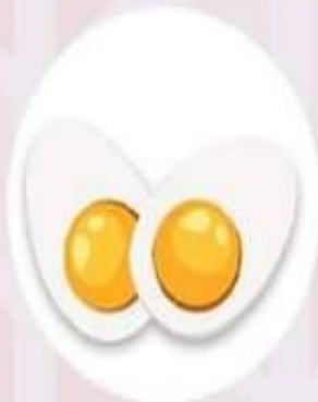
ไข่ต้ม โปรตีนเนิ่นๆ สร้างกล้ามเนื้อ