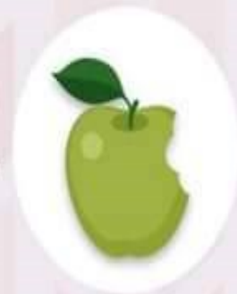
แอปเปิลเขียว ช่วยให้อิ่ม หยิบทานง่าย เก็บได้นานมาก