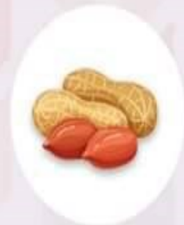
ถั่วลิสง มีใยอาหารและโปรตีน ช่วยให้ไม่หิวเกินไป