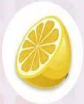
มะนาว ช่วยให้หายหิวได้นาน