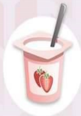
โยเกิร์ตผลไม้ ให้แคลเซียมและเส้นใย จับตัวย่าง่าย