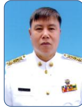
ส.ต.ต.ชมชาติ กัปปะพะ อ.แม่จัน เขต 3