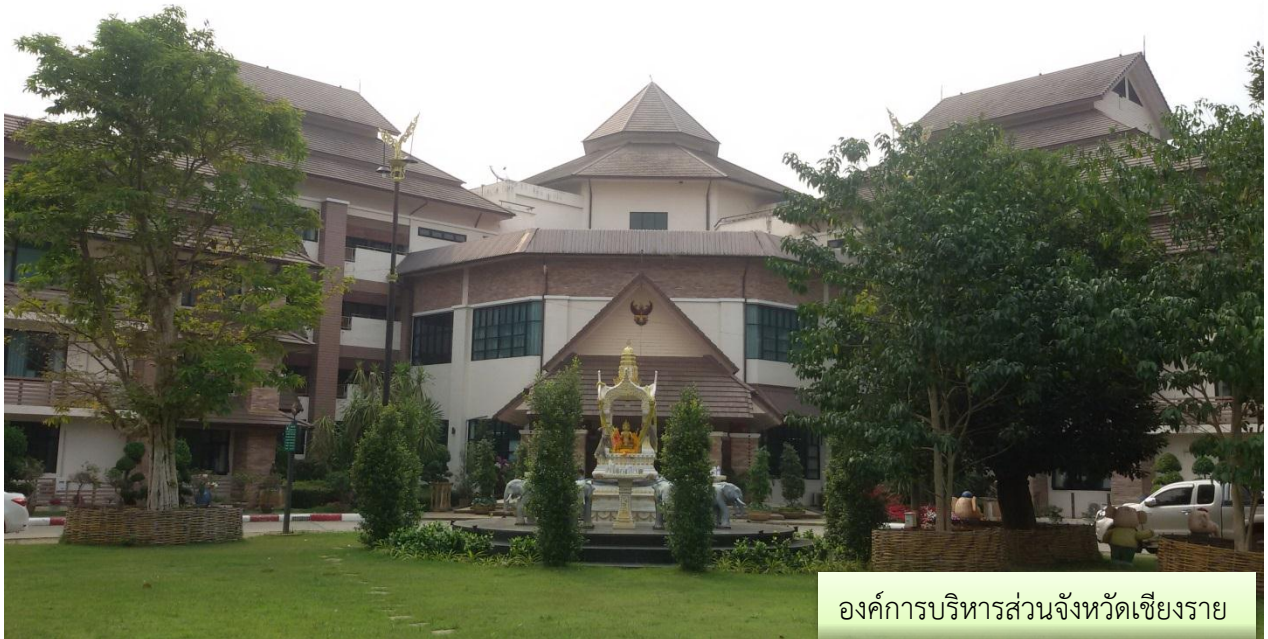
องค์การบริหารส่วนจังหวัดเชียงราย

มีหน้าที่ความรับผิดชอบเกี่ยวกับงานตรวจสอบบัญชี ทะเบียน และเอกสารที่เกี่ยวข้อง งานตรวจสอบเอกสารการรับเงิน การเก็บรักษา หลักฐานการเงิน การบัญชี การจัดเก็บรายได้ ยอดเงินทดลองราชการคงเหลือให้ตรงตามบัญชี หลักฐาน เอกสารทางบัญชี รวมทั้งการควบคุมเอกสารทางการเงิน การใช้ และการเก็บรักษายานพาหนะให้ประหยัด และถูกต้องตามระเบียบของทางราชการ งานติดต่อประสานงาน