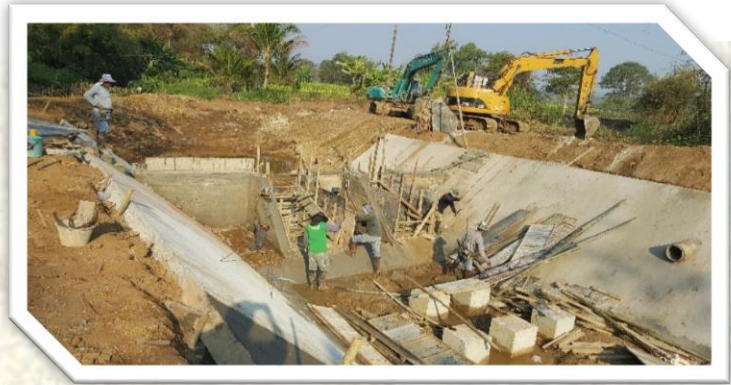
ระหว่างดำเนินงาน